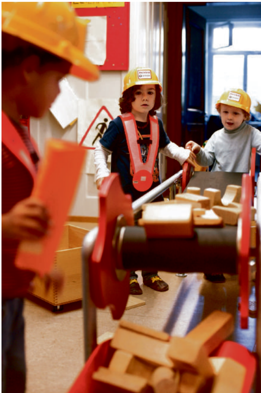
Die Bauecke im Artergut zieht Buben und Mädchen an.

Keller hat sich intensiv und systematisch mit dem Thema Frühförderung befasst, sie besuchte Kitas im Ausland, studierte deren Methoden und führte sie Schritt für Schritt im Artergut ein. Das bedeutete einen Paradigmenwechsel: Anstatt Kinder singend und spielend zu beschäftigen und zu betreuen, geht es nun darum, Bildungsprozesse zu unterstützen, wie das in den Montessorikrippen und anderen privaten Kitas bereits der Fall ist.